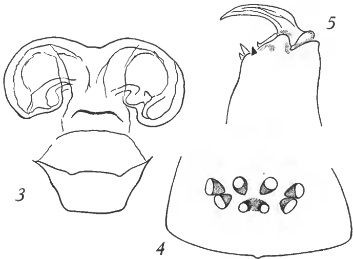
FIG. 3-5 : R. cardesensis sp. nov., ♀.

Le faciès de ce Robertus n'est pas cavernicole, les yeux sont